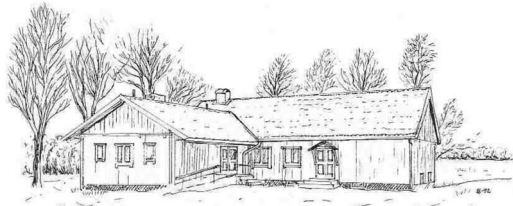
Bolmsö Bygdegård Sjöviken